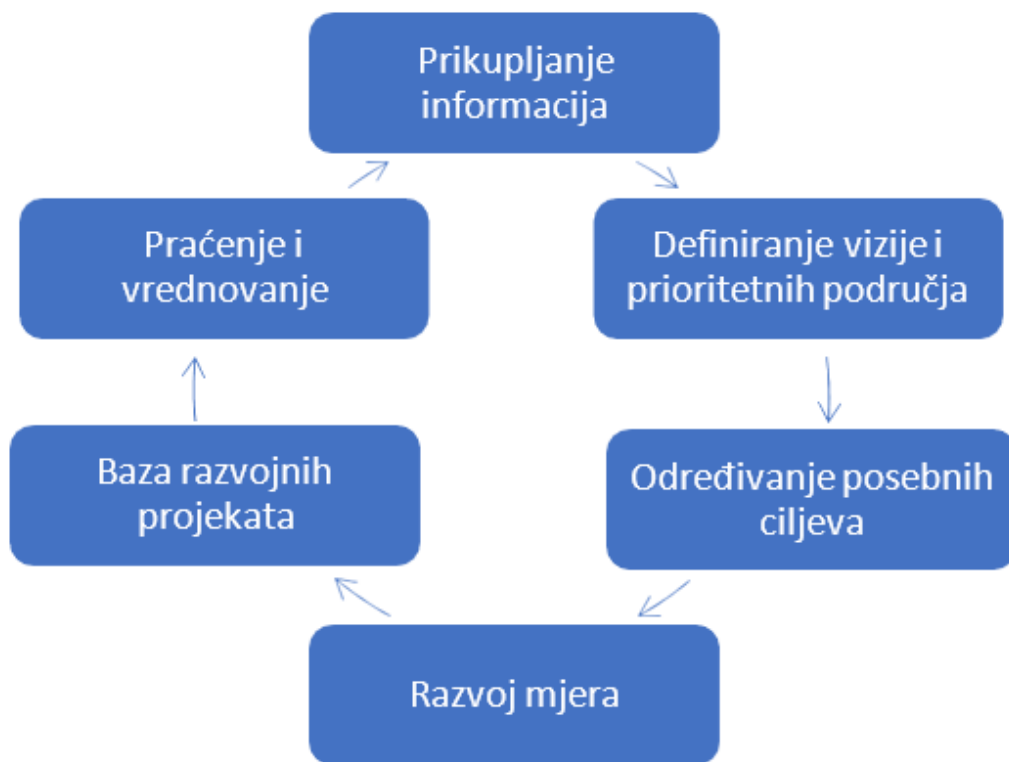
Slika 4.: Prikaz radnji i aktivnosti pri strateškom planiranju; izrada autora

UP Požega definira dva glavna prioritetna područja javnih politika: