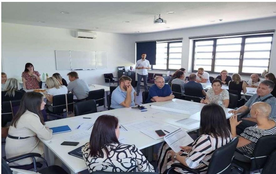
Slika 3.: Druga participativna radionica radnih skupina Partnerskog vijeća 14. srpnja 2022.

Druga participativna radionica radnih skupina Partnerskog vijeća održana je 14. srpnja 2022. godine s ciljem izrade vizije, ciljeva, prioriteta, mjera i prikupljanja projektnih prijedloga za potrebe izrade SRUP-a. Radionicu su vodili i moderirali predstavnici tvrtke BDC koji su angažirani kao izrađivači SRUP-a. Nakon uvodne prezentacije predstavnika tvrtke BDC o viziji, ciljevima, prioritetima, mjerama kao sastavnom dijelu strateškog planiranja svaka je radna skupina u kontekstu svog područja predlagala viziju, ciljeve, prioritete i mjere za izradu SRUP-a. Po završetku rada izabrani predstavnik svake radne skupine prezentirao je rezultate rada svim okupljenima. Nakon završetka prezentacija objedinili su se rezultati rada svih radnih skupina te je izvršena sinteza cjelokupne radionice. Članovima Partnerskog vijeća ostavljena je mogućnost naknadne nadopune predložene vizije, ciljeva, prioriteta i mjera kao i dostavu projektnih prijedloga.