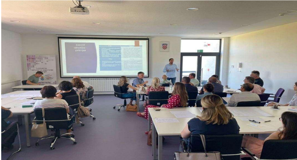
Slika 2.: Prva participativna radionica radnih skupina Partnerskog vijeća 30. lipnja 2022.

Druga participativna radionica radnih skupina Partnerskog vijeća održana je 14. srpnja 2022. godine s ciljem izrade vizije, ciljeva, prioriteta, mjera i prikupljanja projektnih prijedloga za potrebe izrade SRUP-a. Radionicu su vodili i moderirali predstavnici tvrtke BDC koji su angažirani kao izrađivači SRUP-a. Nakon uvodne prezentacije predstavnika tvrtke BDC o viziji, ciljevima, prioritetima, mjerama kao sastavnom dijelu strateškog planiranja svaka je radna skupina u kontekstu svog područja predlagala viziju, ciljeve, prioritete i mjere za izradu SRUP-a. Po završetku rada izabrani predstavnik svake radne skupine prezentirao je rezultate rada svim okupljenima. Nakon završetka prezentacija objedinili su se rezultati rada svih radnih skupina te je izvršena sinteza cjelokupne radionice. Članovima Partnerskog vijeća ostavljena je mogućnost naknadne nadopune predložene vizije, ciljeva, prioriteta i mjera kao i dostavu projektnih prijedloga.